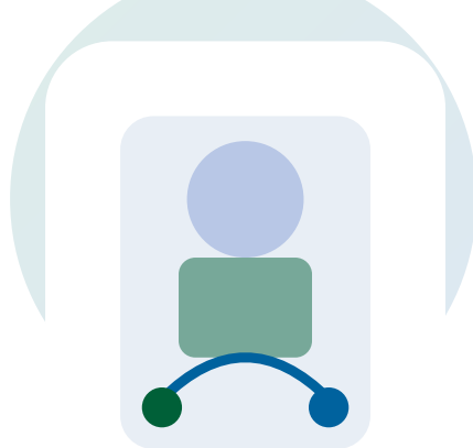
TABELLA A (borse di studio in essere in Banca Popolare di Sondrio)