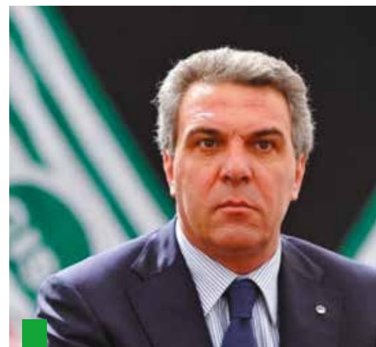
Luigi Sbarra Segretario generale aggiunto Cisl

La libera negoziazione tra le Parti, i luoghi della bilateralità e della contrattazione, sono i canali principali entro cui cercare il giusto equilibrio tra la flessibilità richiesta dalle aziende e le inderogabili rivendicazioni avanzate dalle lavoratrici e dai lavoratori. Si tratta di adeguare salari, naturalmente, ma non solo quelli. Vanno riallineate anche tutte le altre voci che compongono la parte normativa, previdenziale e assistenziale del rapporto di lavoro. Per questo