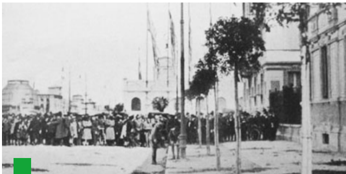
12 aprile 1928, l'attentato a Vittorio Emanuele III in piazzale Giulio Cesare (ingresso della Fiera)