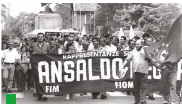
Una delle tante manifestazioni di protesta dei lavoratori della Tosi