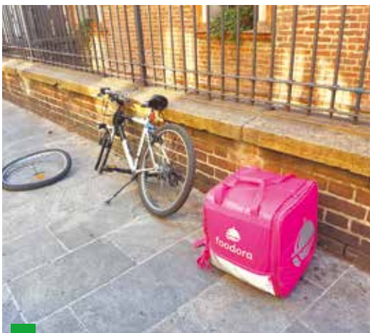
Il tema della sicurezza è uno degli aspetti principali da regolare insieme alla questione dei salari e della previdenza

È una battaglia culturale che per i cibi biologici, ad esempio, ha già dato dei frutti. L'utente è disposto a pagare di più per la bio-sostenibilità. E dovrei essere pronto a pagare di più una pizza a domicilio se so che chi me la porta è tutelato.