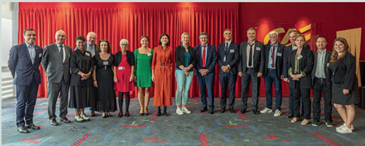
Firma dell'Accordo Quadro Internazionale il 9 ottobre 2023 a Montrouge.

L'accordo completo è disponibile sul sito web del Comitato Aziendale Europeo www.ewcgca.com