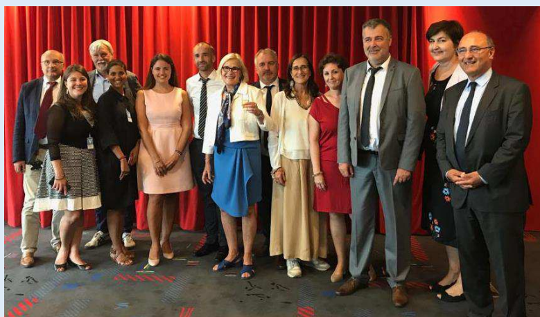
Equipe de négociation et Direction (signature du 31 juillet)

Seule une fédération syndicale mondiale peut signer un accord de cette portée. C'est ainsi qu'UNI a signé cet accord au nom des différentes organisations internationales présentes et adhérentes dans le Groupe Crédit Agricole. Les travaux de l'UNI ont été préparés avec l'alliance syndicale internationale mise en place depuis plusieurs années au sein du Groupe.