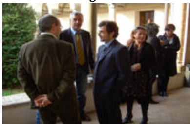
L'arrivo dei delegati