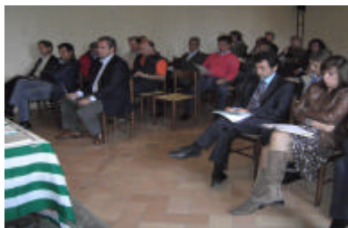
La sala dei delegati