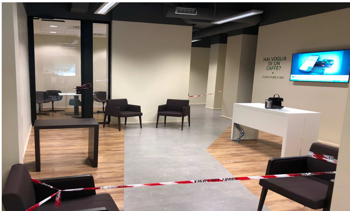
(Messina- Foto di un parte dei locali dell'Agazia Europa interdetti dai Vigili del Fuoco)

Contestualmente chiediamo ufficialmente un incontro con i vertici aziendali per affrontare, una volta per tutte, i temi della sicurezza e delle evidenti carenze strutturali, strumentali e funzionali dell'Agazia Europa di Messina.